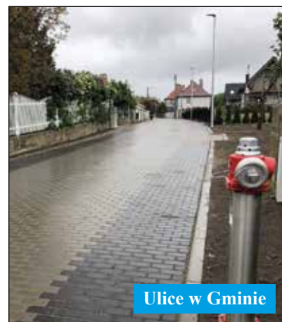
Ulice w Gminie